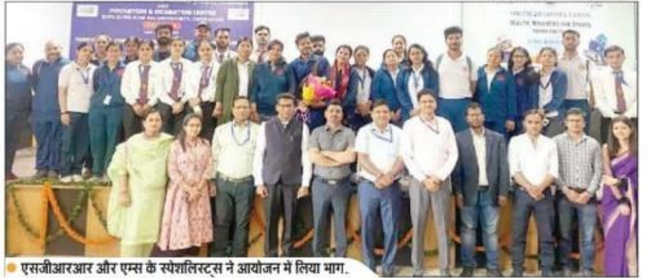
एसजीआरआर और एम्स के स्पेशलिस्ट्स ने आयोजन में लिया भाग.