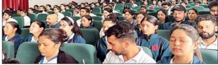
सम्मेलन में उपस्थित छात्र।

श्री गुरुरामराय विश्वविद्यालय में पारंपरिक चिकित्सा और योग विषय पर यूथ20 सम्मेलन का आयोजन किया गया।